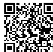
中小企業投資促進税制