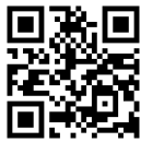
最新情報を確認 IT補助金サ イト

中小企業、小規模事業者が、業務効率化やDXのために導入するITツール等が対象です。 今回から導入関連費が拡充され、IT活用の定着を促す導入後の”活用支援”も対象となります。