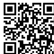
省力化補助金 (カタログ注文型)