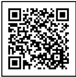
持続化補助金 <通常枠>