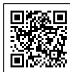
ものづくり補助金 サイト