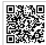
東京海上日動火災 パンフレット

商工会の「ビジネス総合保険」は、既存制度で補償していたPL、リコールによる賠償責任に加え、施設、業務遂行、管理財物に対する賠償責任もラインナップし、事業者を取り巻く事業活動リスクを総合的に補償します。右の東京海上日動火災のほか計4社のプランが検討できます。